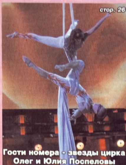
Гости номера - звезды цирка Олег и Юлия Пospelовы

№ 06 (79) 2011 ВСЕУКРАЇНСЬКИЙ ЩОМІСЯЧНИЙ ЖУРНАЛ